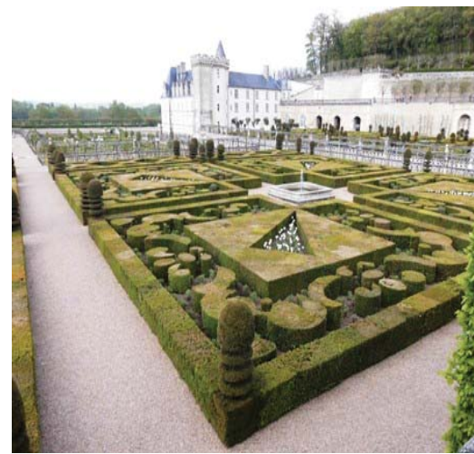
Schloss Villandry mit Gärten