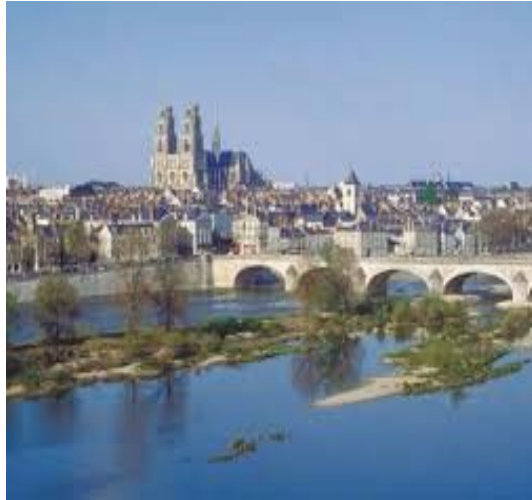
Stadtansicht von Tours