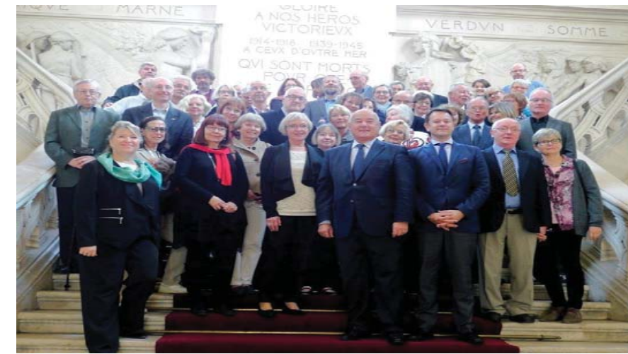
Unsere Reisegruppe beim Rathausempfang