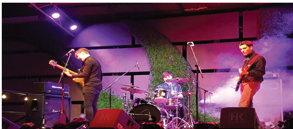
Die Formation „The Circus Villains“ aus Darlington überzeugte mit ihrem Auftritt